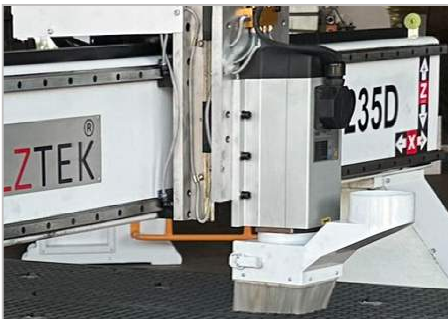
Motor trục router 6Kw HQD