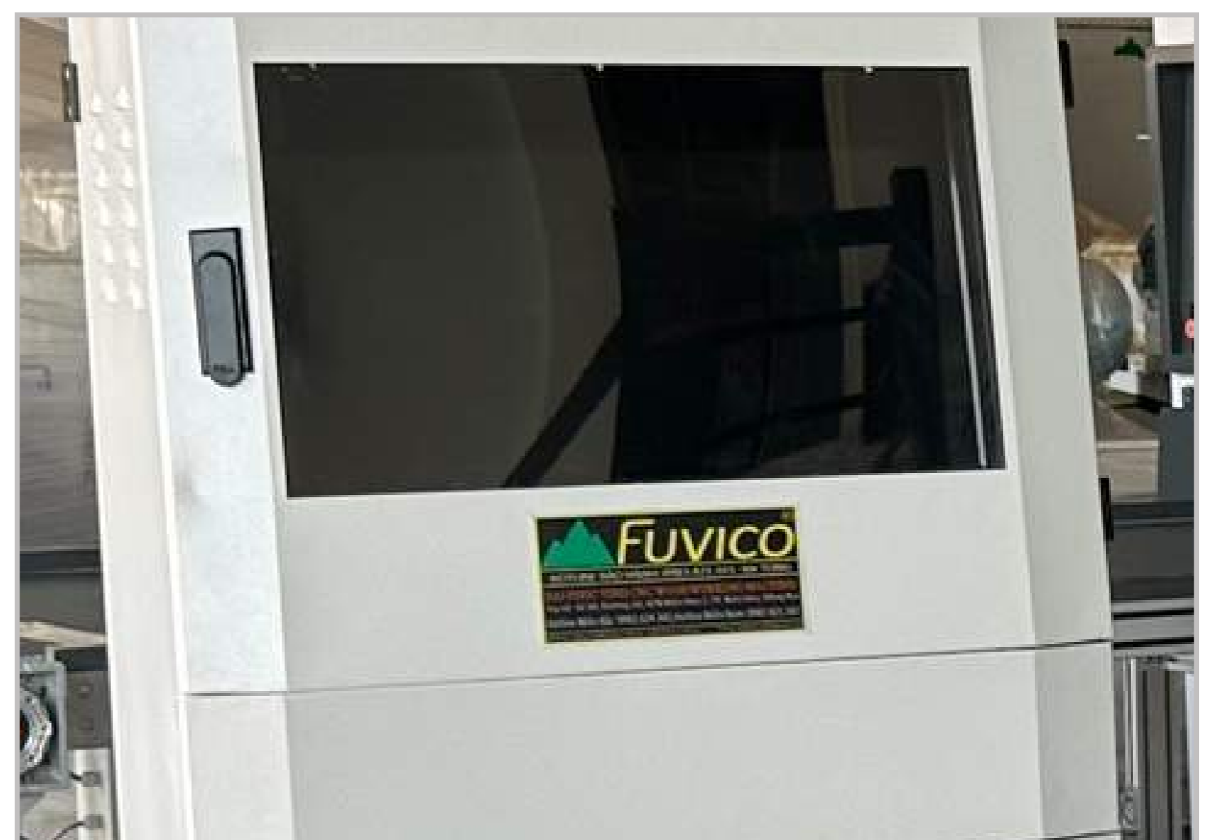
Máy tính lập trình, màn hình điều khiển lớn