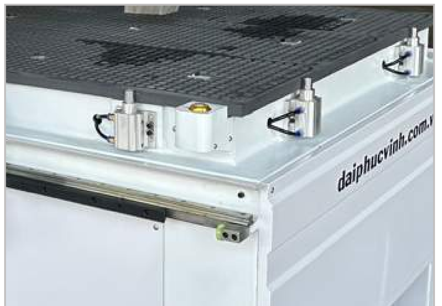
Hệ thống ben cố định phôi