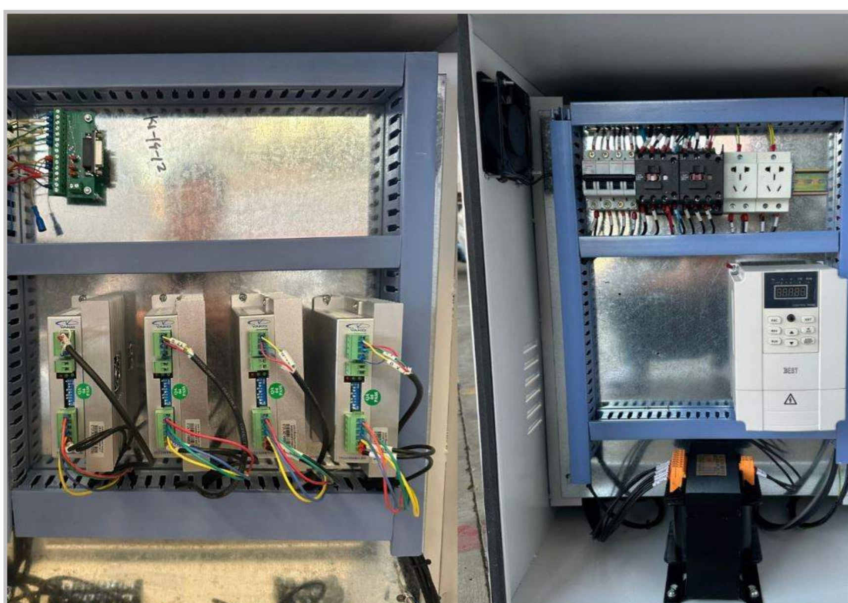
Linh kiện điện cao cấp