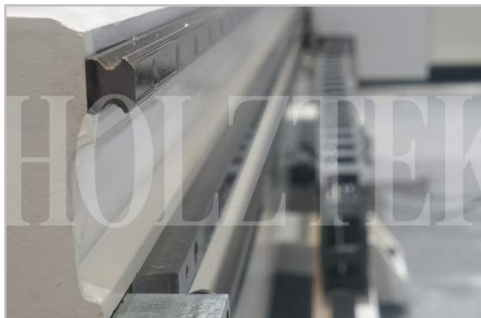
Hệ thống Ray trượt, bánh răng Đài Loan