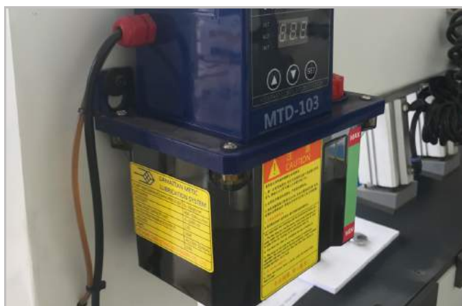
Hệ thống bơm nhớt tự động bảo vệ máy