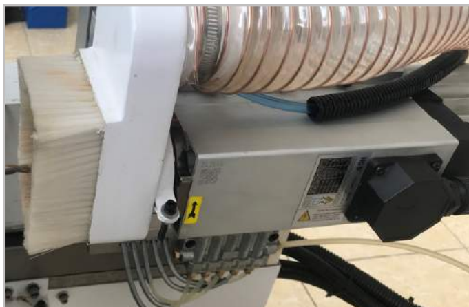
Motor khoan 2,2 Kw mạnh mẽ