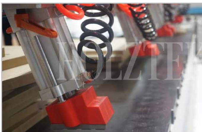
Hệ thống 7 ben kẹp phôi chắc chắn