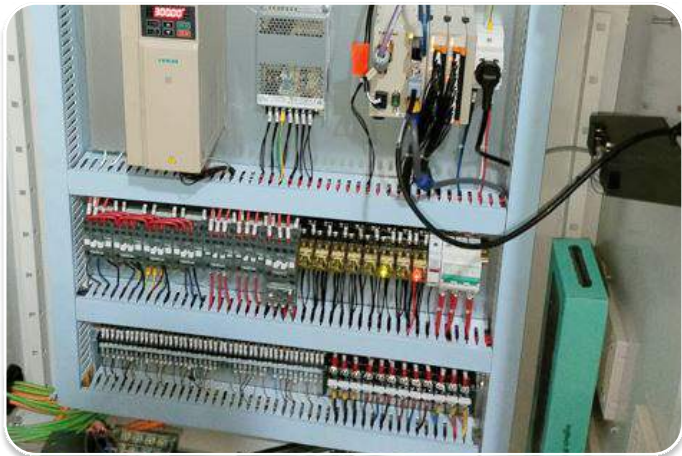
Linh kiện điện Schneider Pháp