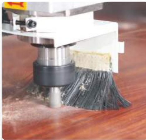
Khoan chi tiết chính xác