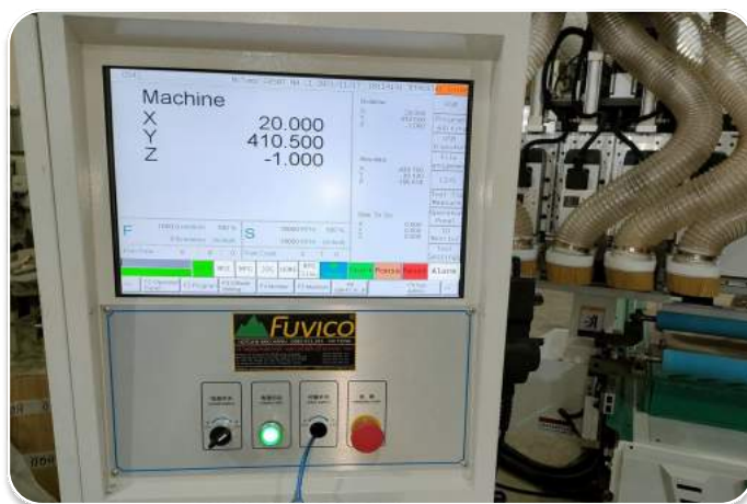
Bộ điều khiển trung tâm: LNC – Đài Loan