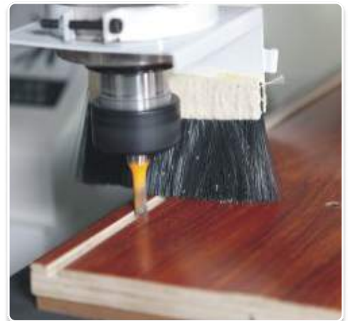
Cắt router, chạy rãnh