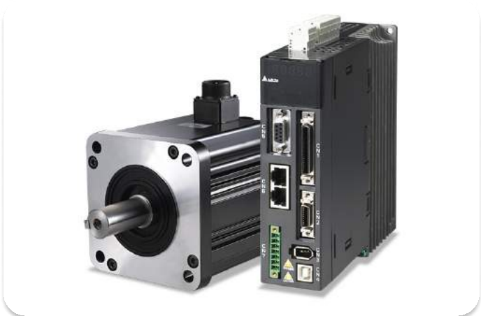
Hệ thống Driver, Servo: Delta – Đài Loan