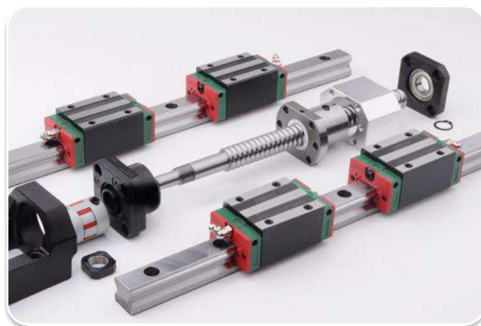
Hệ thống bạc đạn, ray trượt Germany