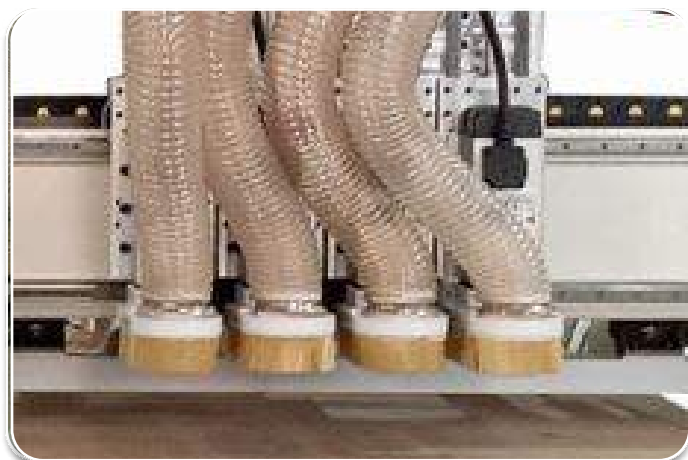
Công suất đầu Router: 6Kw x 4pcs