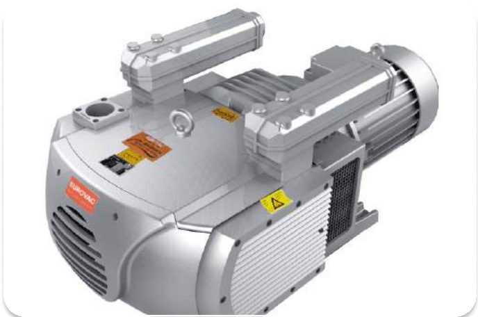
Bơm chân không dạng khô Eurovac Đài Loan