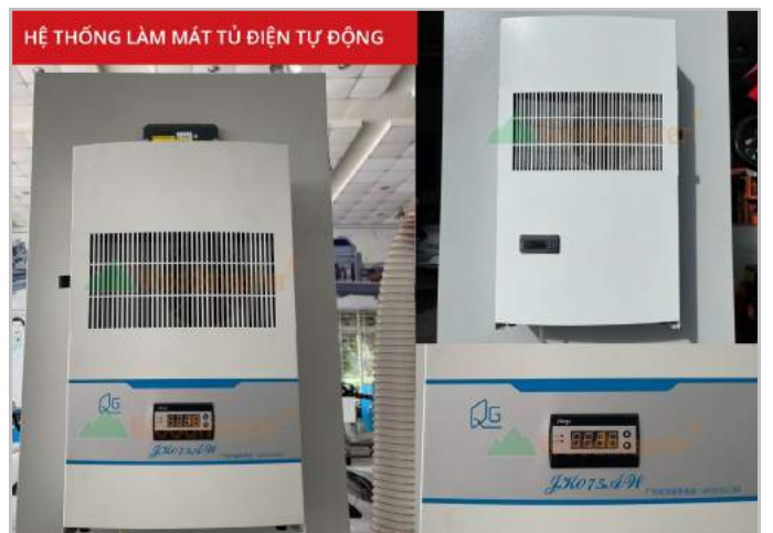
Hệ thống làm mát tủ điện tự động