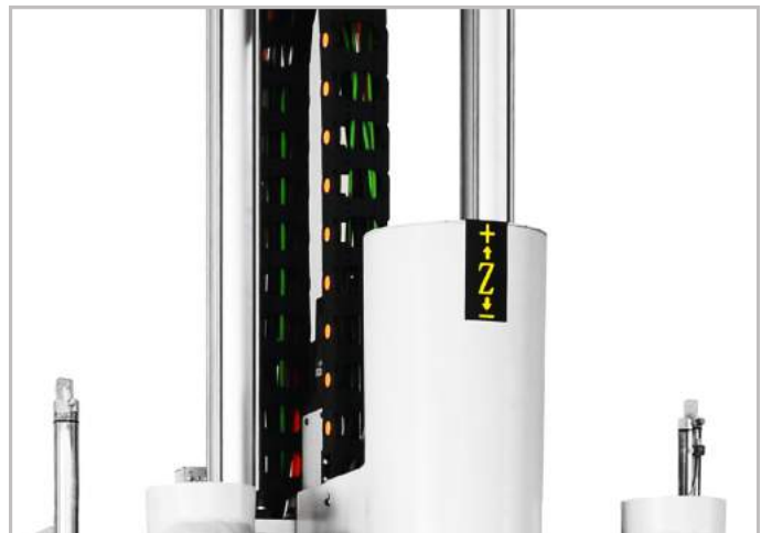
Cáp điện và ống dẫn cáp IGUS Đức

Máy có hai bàn làm việc ký hiệu V và Y kích thước là 1200x1200mm, có thể làm việc độc lập – mỗi bàn 1 sản phẩm, hoặc ghép 2 bàn thành 1 để gia công những sản phẩm kích thước lớn