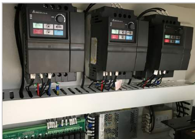
Biến tần chỉnh tốc độ trực tiếp