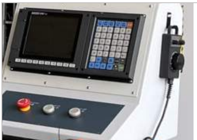
Hệ thống điều khiển: Hust – Taiwan