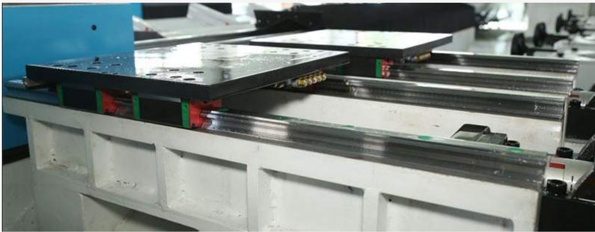
Hệ thống day trượt Đài Loan