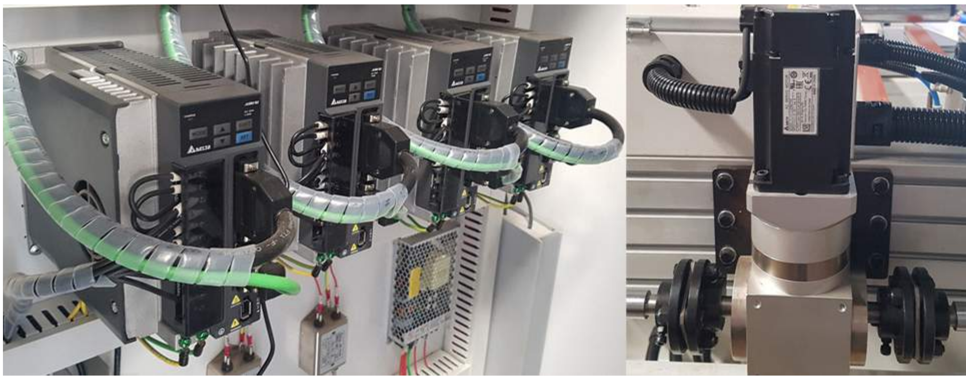
Hệ thống motor servo/driver: Delta Đài Loan