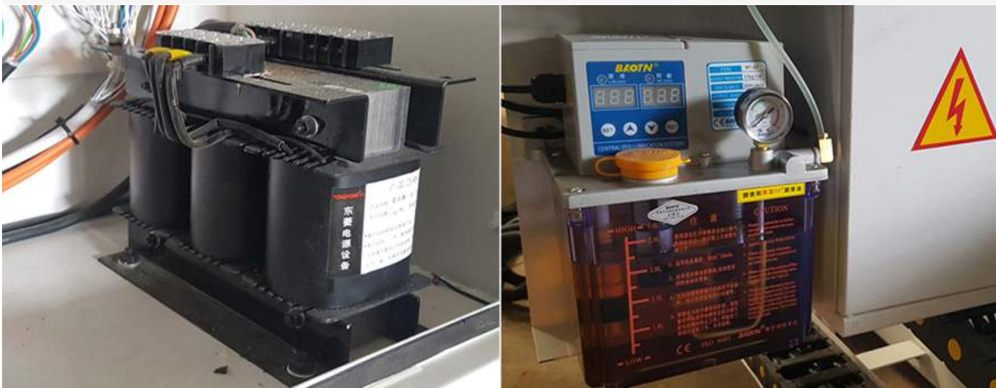
Biến áp bảo vệ dòng điện - Bơm nhớt tự động bảo vệ ray trượt