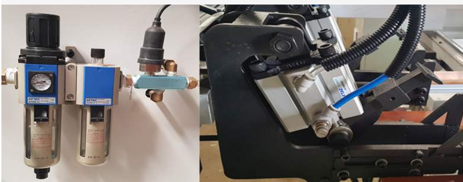
Hệ thống khí nén: Airtac Đài Loan