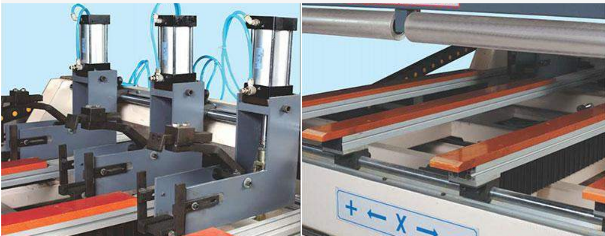
Hệ thống kẹp, tì phôi bằng khí nén