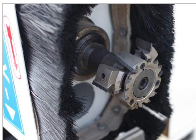
Motor tải nặng và có độ chính xác cao