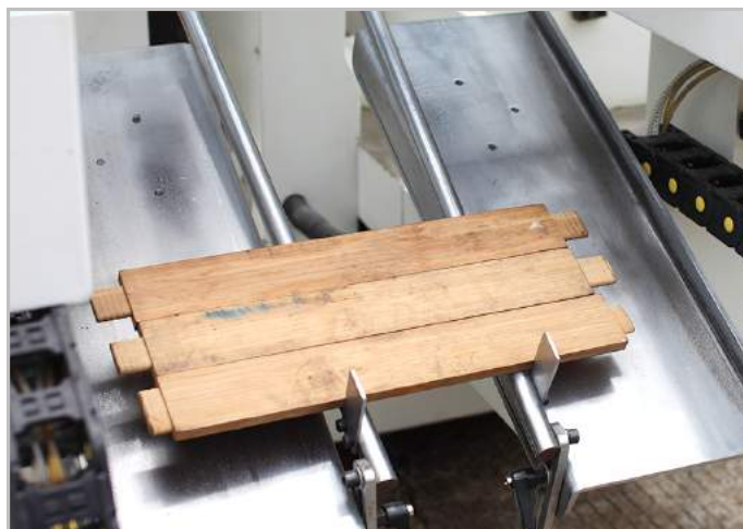
Hệ thống thu hồi phôi