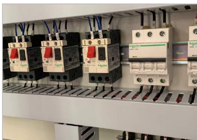
Thiết bị điện : Schneider Pháp