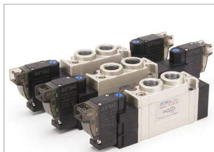
Solenoid valve : Airtac Đài Loan