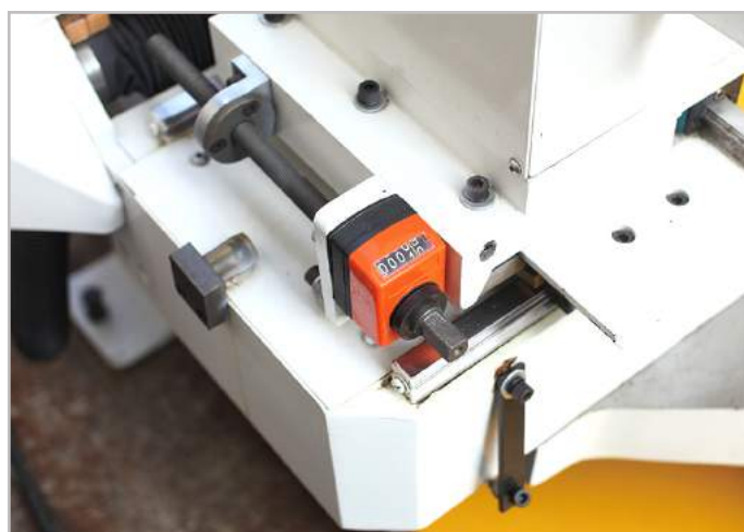
Hệ thống ray trượt vít me : Đài Loan