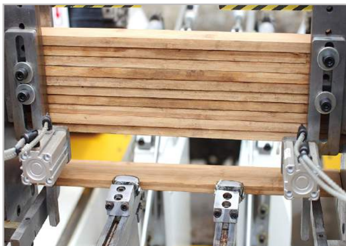
Nạp phôi tự động