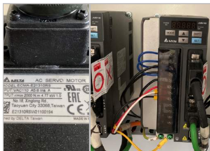
Hệ thống servo, driver: Delta Đài Loan