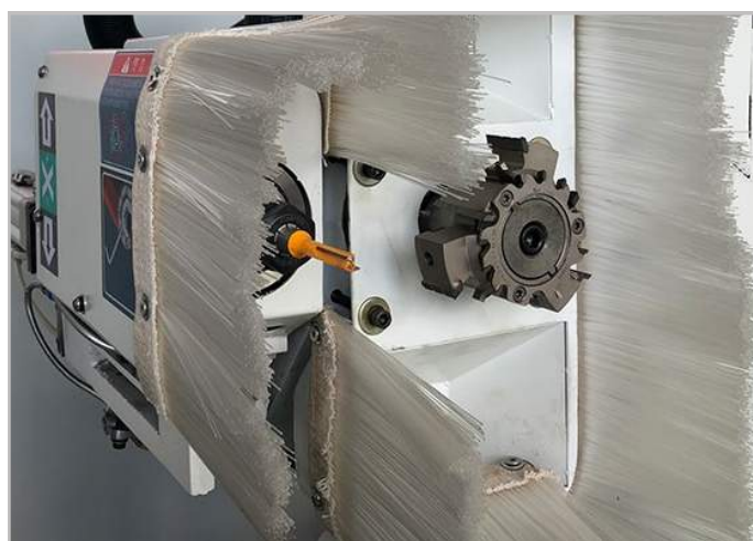
Motor tải nặng và có độ chính xác cao