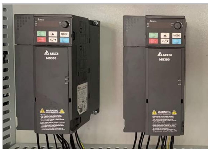
Biến tần chỉnh tốc độ trực dao