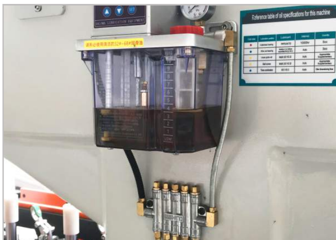
Hệ thống bôi trơn tự động