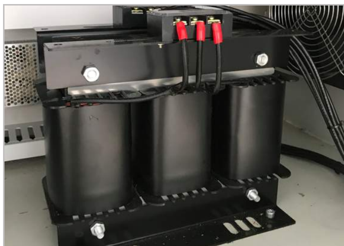
Biến áp bảo vệ máy