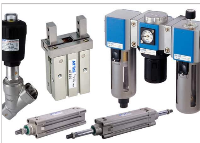
Linh kiện hơi : Airtac - Taiwan