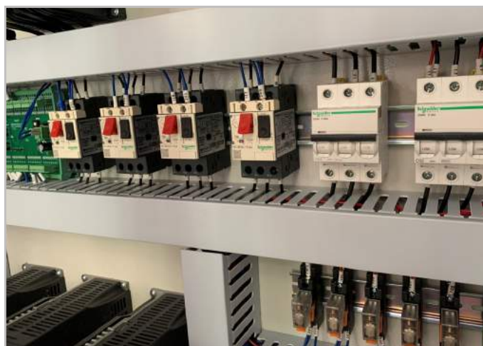
Thiết bị điện cao cấp