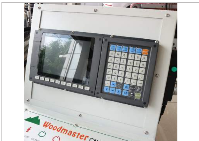
Hệ thống điều khiển: Hust – Taiwan